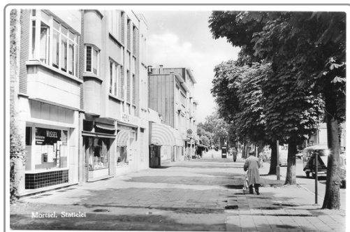
Kantoor Statielei 1959